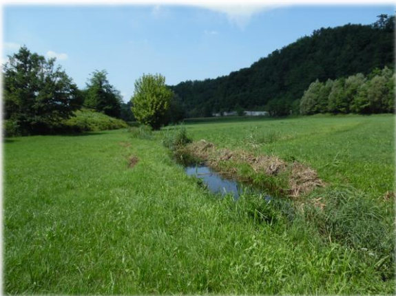
L'area dove sorgerà la cassa sul Fiume Olona.

La maggior parte degli interventi previsti si inserisce entro un contesto delicato dal punto di vista cantieristico (spazi ristretti, presenza di attività commerciali o edifici privati) e per questo motivo il bando di gara assegnava una notevole importanza allo studio cantieristico degli interventi. Altri aspetti da valutare nell'offerta erano lo studio del cronoprogramma di lavoro e la qualità dei materiali utilizzati.