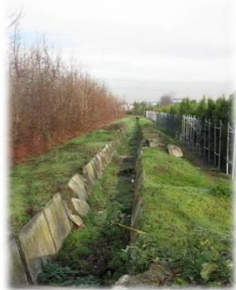
Particolare del canale diramatore 8 di Valle Seveso nello stato di fatto.

Importo dei lavori e sicurezza: 79'456.83 €