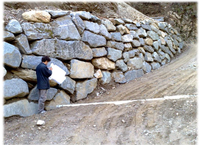
Rilievo di misura di una scogliera a protezione della strada di accesso all'opera di presa.