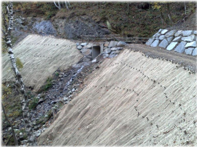
Realizzazione di tombotto e di cordone vive.