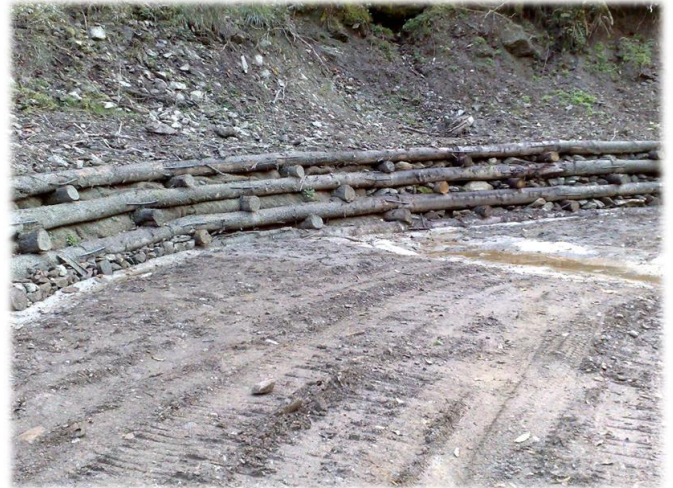
Palificate lungo la strada.