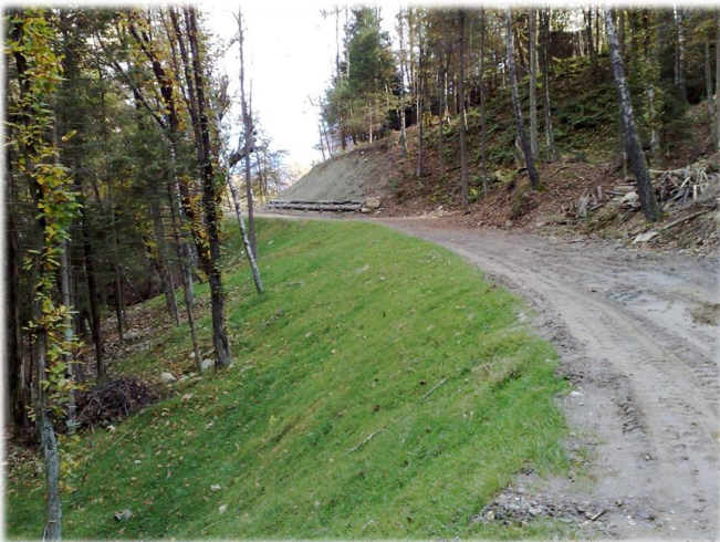
Inerbimento delle scarpate a fianco al canale di derivazione.