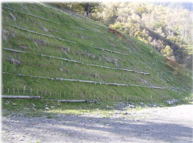
Grata viva sopra la vasca di carico.

I lavori conclusi hanno mostrato un buon risultato con il mascheramento degli impatti maggiori dell'impianto idroelettrico (centrale e scarpate lungo il canale) e la riduzione dei fenomeni di dissesto lungo la strada, utilizzando tecniche quasi completamente naturali e dunque a basso impatto visivo.