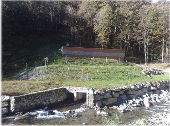
Opere di ingegneria naturalistica presso la centrale.

Ente committente: Ecowatt Energie Rinnovabili s.r.l.