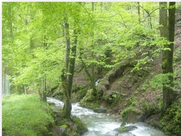
Poco a valle della presa.

Definizione del DMV da rilasciare e progetto di adeguamento della presa per ottemperare alle direttive regionali.