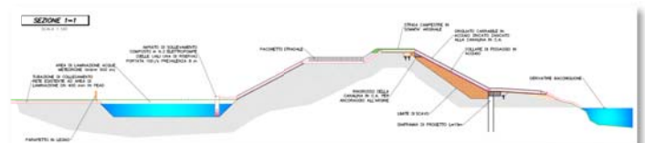
Studio gestione dell'acqua a tergo del rilevato.