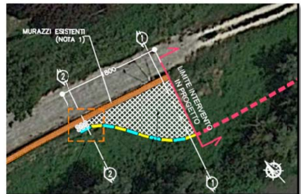
Particolare opere di collegamento.