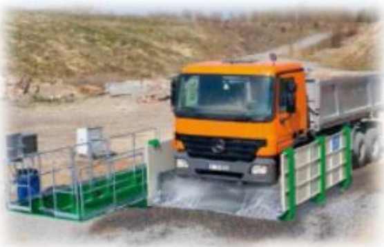
Esempio di miglioria proposta.